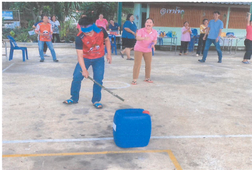
-กิจกรรมนันทนาการ